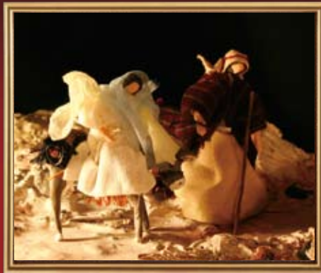
ベツレヘムへの旅